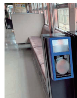
車載型 IC 改札機

当社は、車載型のIC改札機を株式会社JR西日本テクシアと共同開発し、2019年に境線(米子~境港駅間)で運用が開始されました。本製品は、①GPSによる位置情報、②車輪の回転数により移動距離を計測する速度発電機の情報、から駅判定演算を行い、停車予定駅と照合して停車駅を特定します。これにより、各駅の改札機能を車両に搭載できるようになったため、駅の環境に依存することなく、ICシステムを導入することが可能となりました。本機を運用する路線は、徐々に拡大中です。