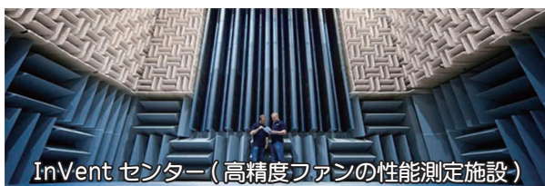
InVent センター（高精度ファンの性能測定施設）

環境大国ドイツのメーカーならではの、環境に配慮した革新的製品を開発し続け、皆様の省エネルギー対策に貢献し続けて参ります。