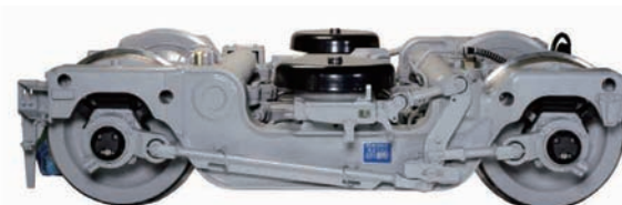
仙台市交通局：東西線 2000 系用操舵台車

これからも新日鐵住金は、技術開発を進め、鉄道車両の安全と快適性・環境性の向上に努めてまいります。