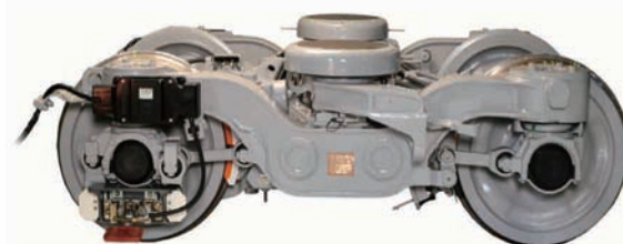
東京メトロ：銀座線 1000 系用操舵台車

近年、量産投入されました操舵台車は、優れた曲線通過性能と、横圧、騒音、車輪フランジ摩耗、レール振動、曲線通過抵抗等に高い改善効果を有しており、東京メトロ銀座線1000系や仙台市交通局東西線2000系でご利用頂いております。