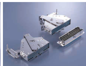
角型 QE コネクタ

また、電気連結器は200本以上の信号線を一度に接続出来るもので、長く新幹線に使用されております。