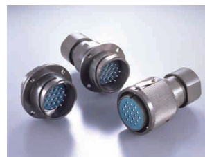
防水丸型 GTC コネクタ

コネクタは鉄道車両の内装、外装の各用途向けに多種製品をラインナップしており、国内及び海外の鉄道案件に使用されております。